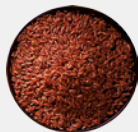
RISO INTEGRALE ALTA DIGERIBILITÀ