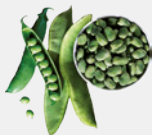
LEGUMI PROTEINE E VITAMINE VEGETALI